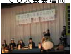
若帖タイム全校発表会 12月14日に、総合的な学習の時間の全校発表を行いました。

11月11日(土)文化祭が行われました。午前中の製作の部は、板餅、そば、小正月飾りなど九の部に分かれ、地域の指導者やPTA役員の協力で活動しました。午後は、文化芸能の部で合唱コンクール、今年は何庭・大塩野離子会等の郷土芸能等、大変充実した内容でした。 若帖タイム全校発表会 12月14日に、総合的な学習の時間の全校発表を行いました。