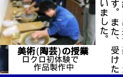
美術(陶芸)の授業 ロクロ初体験で作品製作中