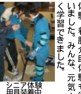
シニア体験中 用具装着中

三田川小学校児童、吉田小学校児童が小鹿野高校生と実施 2月9日に吉田小の四年生が吉田小学校で、20日には三田川小の五年生が小鹿野高校で、高校生が補助により福祉の授業を体験しました。 三田川小は、インスタントシニア体験、吉田小は、シニア体験加えて、車イス体験、着脱介助体験も行いました。みんな、元気よく学習できました。