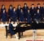
文化祭の合唱の様子

11月4日、合唱祭を中心とした文化祭が実施されました。最優秀賞の三年生のクラスが、「走る川」の合唱で県中学校音楽会地区大会に参加しました。 一年生スキー教室 1月25日から一泊二日で、苗場スキー場浅貝ゲレンデでスキー・スノーボードに取り組みできました。