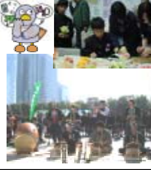
全国産業教育フェアの様子

11月11日から三日間、さいたまスーパーアリーナで本校生徒62名がスタッフとして参加し、生徒作品展示、太鼓演奏や歌舞伎化粧、福祉、フラワーアレンジ、尺八体験のコーナーを全国に向け開設し大成功を収めました。