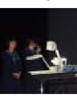
キャリア教育発表の様子

生徒一人ひとりの勤労観、職業観を育てるためのキャリア教育を進めている。その取り組みの一つとして情報活用能力の育成がある。現在一学年では「職業調べ」、二学年では「高校調べ」を様々な情報を活用し、まとめている。また、三学年は進路決定に向けて、表現力の向上や学習への取り組みを行っている。 一学年「職業調べ」 インターネット等を利用した職業調べと、生徒の関心の高い職業のビデオ視聴を通して、職業の理解を深めた。 二学年「高校調べ」 情報を収集・整理してわかりやすい発表であった。ゲストに高校三年生を招いて、「高校生生活」を語ってもらった。生徒の視野を広めることが出来た。 三学年 自分自身の三年間を振り返るために、「自分史新聞」を作成している。また、中高一貫選抜でのレポート発表などで、表現力の向上に努めた。