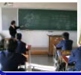
数学の授業風景 「生活の中の数学」について学習